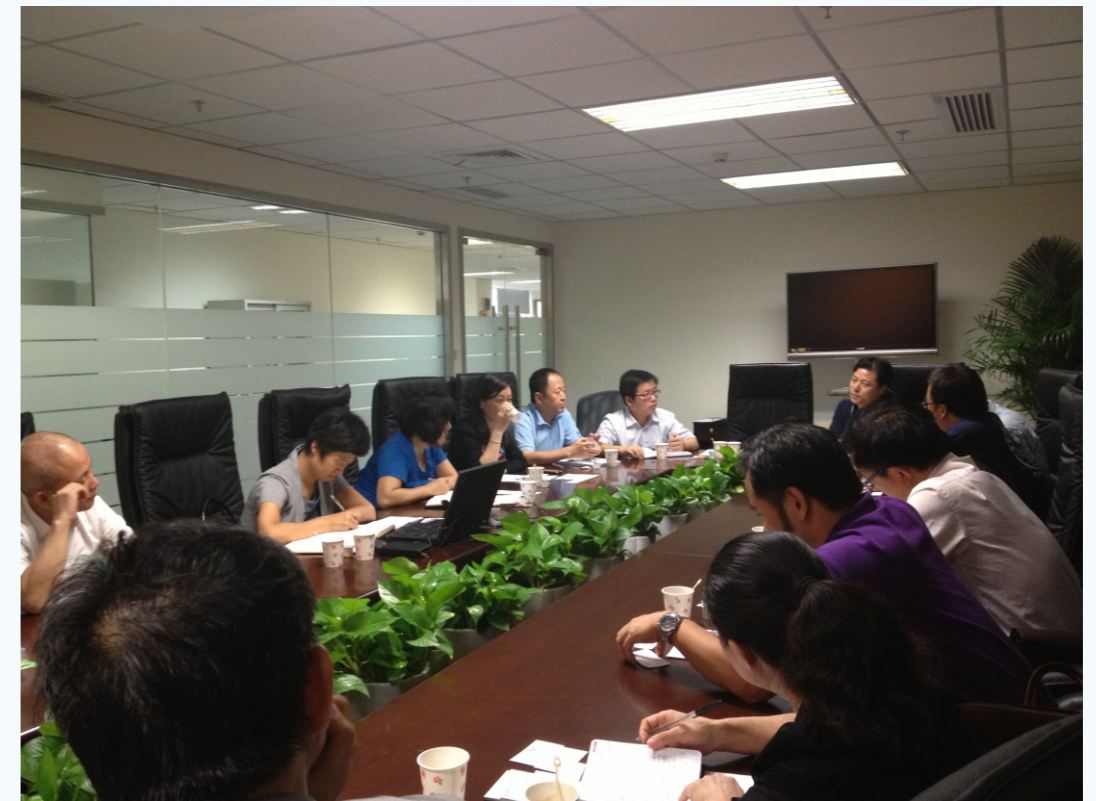
参会人员热烈的讨论