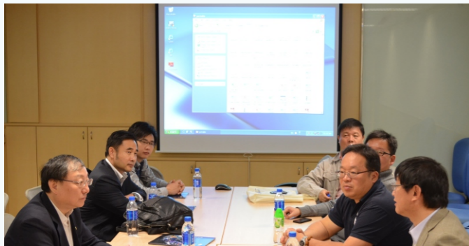
接待团与访问团开展座谈会