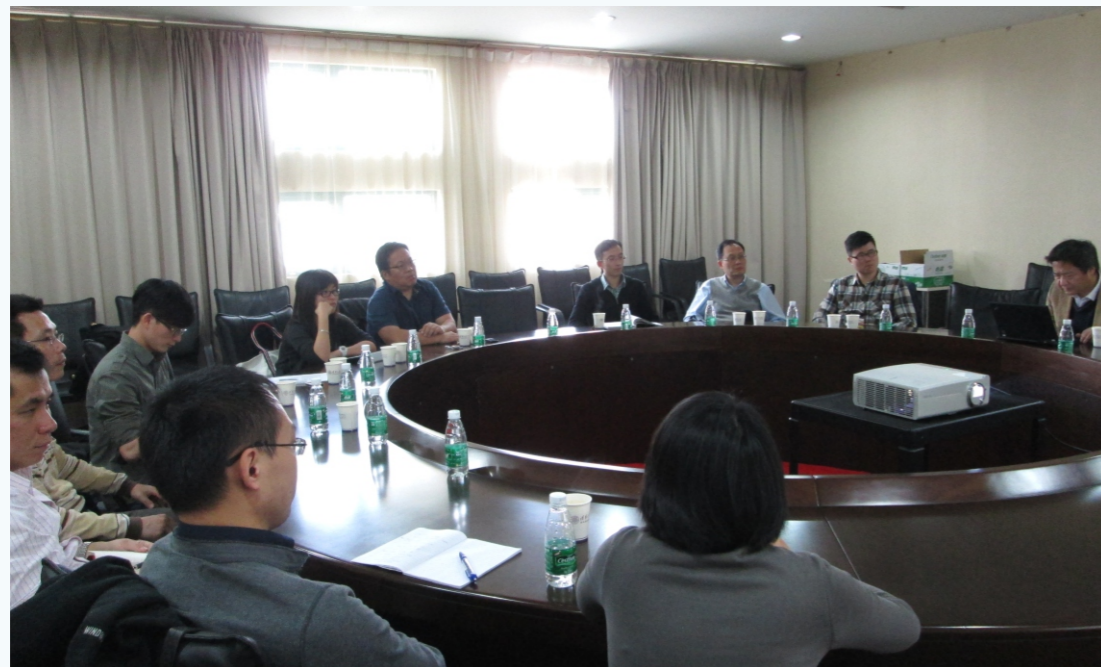
交流单位的学术交流会现场

此次座谈会是SMART成立后理事单位间的第一次学术交流与合作，是SMART正式运作迈出的重要一步。SMART的未来规划和项目申请探讨不仅促进了成员间的交流与合作，而且还整合了成员间的优势资源，对SMART未来发展具有重要意义，也为以后SMART成员间的交流与合作提供示范。