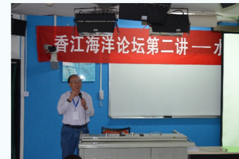
中国科学院海洋研究所周名江教授发言

此次香江论坛不仅加强了成员单位之间的交流与合作，还得到政府部门海洋管理人员与联盟以外单位的大力支持，说明官产学研均对海洋领域的发展高度重视，同时证明了SMART平台强大的协同创新力量，为联盟进一步的发展奠定了信心。通过此次学术交流，我们发现国内水下观测仪器尚未形成完整产业，仍有较大发展空间，未来或可形成以下的技术方向：1) 海洋微生物水下偏振光散射及多普勒粒子探测技术；2) 船载、车载及水下质谱技术；3) 面向海洋环境立体监测的水下多机器人协作系统；4) 潜水员水下声纳面镜。未来SMART将继续推动海洋领域的协同创新，通过加强海洋科学与技术的研发和自主创新，为深圳国家海洋经济科技发展示范市创建提供支撑。